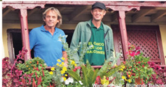
Wanderung 9 - Blühende Balkone

Gehzeit: ca. 2,5 h | Preis: 30 € Beginn: 10:30 Uhr | Casa Cristal Touristeninformation Santa Cruz Transfer auf Anfrage