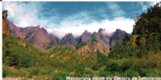
Wanderung durch die Caldera de Taburiente

Höhenmeter: +500 m/-1250 m | Wegstrecke: 20 km | Gehzeit: 6 h Angebot nur für Kleingruppen ab 5 Personen / Preis auf Anfrage Auf Wunsch: frühzeitiger Beginn mit Sonnenaufgang als Highlight