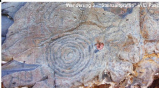
Wanderung 3 - "Steinzeitgraffiti" in El Paso

Höhenmeter: +140 m/-140 m | Wegstrecke: 4 km | Dauer: ca. 3,5 h | Preis: 35 € Beginn: EP 12:30 Uhr | Touristeninfo El Paso