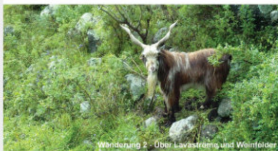
Wanderung 2 - Über Lavaströme und Weinfelder

Daten der jeweiligen Wanderung auf Anfrage. Beginn: 09:30 Uhr | Ende: ca. 16:00 Uhr | Preis 55 €