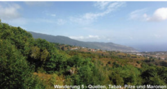
Wanderung 5 - Quellen, Tabak, Pilze und Maronen

mehrere kleine und leichte Spaziergänge | Preis: 69 € Beginn: PN: 08:30 Uhr | LC: 09:10 Uhr | SC: 09:20 Uhr | Ende: ca. 17:00 Uhr Für Kreuzfahrttouristen geeignet, passend zu den An- Ablegezeiten der Schiffe