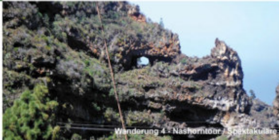
Wanderung 4 - Nashorntour / Spektakuläre

Höhenmeter: +200 m/-400m | Wegstrecke: 9,5 km | Gehzeit: 3,5 h | Preis: 55 € Treffpunkt: PN: 10:00 Uhr | Ende: ca. 18:00 Uhr