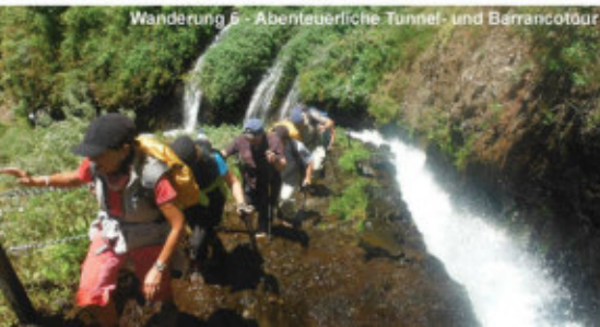
Wanderung 6 - Abenteuerliche Tunnel- und Barrancoutour