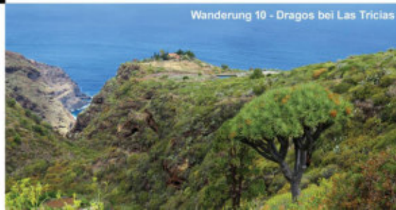
Wanderung 10 - Dragos bei Las Tricias

Höhenmeter: +250 m/-450 m | Wegstrecke: 6 km | Gehzeit: 2,5 h | Preis: 55 € Beginn: PN: 10:00 Uhr | Ende: ca. 18:00 Uhr