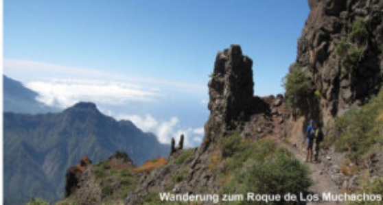
Wanderung zum Roque de Los Muchachos

Höhenmeter: +350 m/-350 m | Wegstrecke: 8 km | Gehzeit: 3 h | Preis: 55 € Beginn: PN: 10:00 Uhr | Ende: ca. 18:00 Uhr