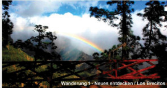
Wanderung 1 - Neues entdecken / Los Brechitos