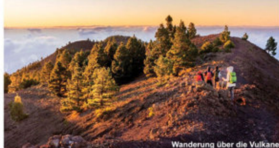
Wanderung über die Vulkane